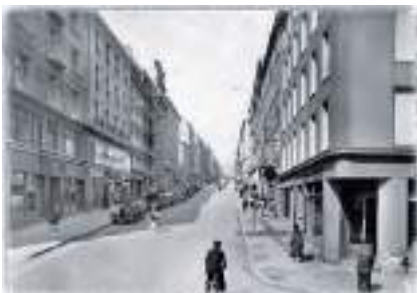
Chez Touz : l'un des temples brestoises de la pâtisserie

"Souvenirs de Jeanne Toussaint à la recherche de notre madeleine ..."