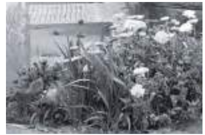
Avant : trottoirs fleuris