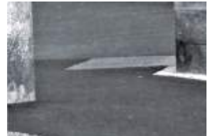
Après : joli bitume, contribution à l'embellissement de Brest et à sa politique de développement durable...

Prochaine visite de quartier : Harteloire, jeudi 3 juin - 17h30 place général de Bollardière