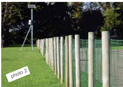
photo 2 : 2 otohP