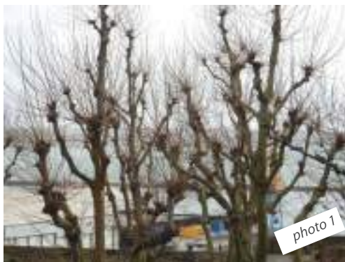
: 1 otohP .tojaD sruoC

Retrouvez les lieux photographiés. (réponses sur cette page)