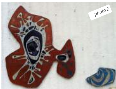
: 2 otohP hcoFenicsiP